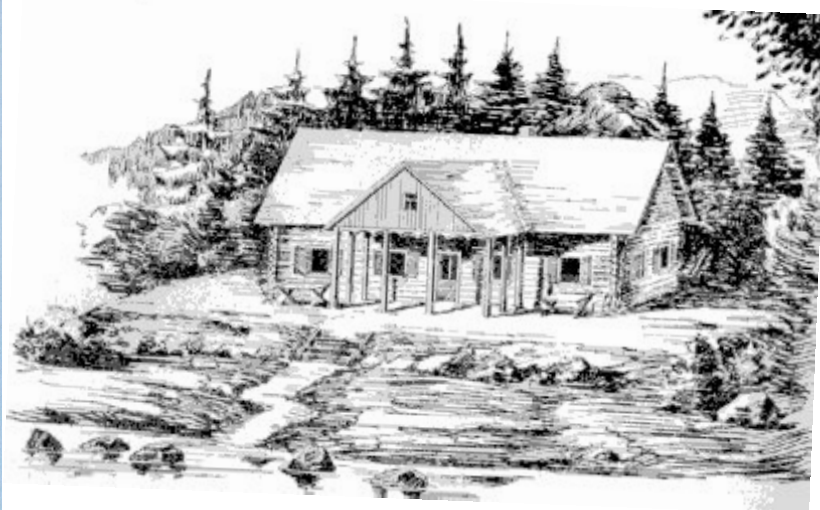
Jozefova chata - prvá kúpeľná budova postavená pri jazere Štrbské pleso roku 1875