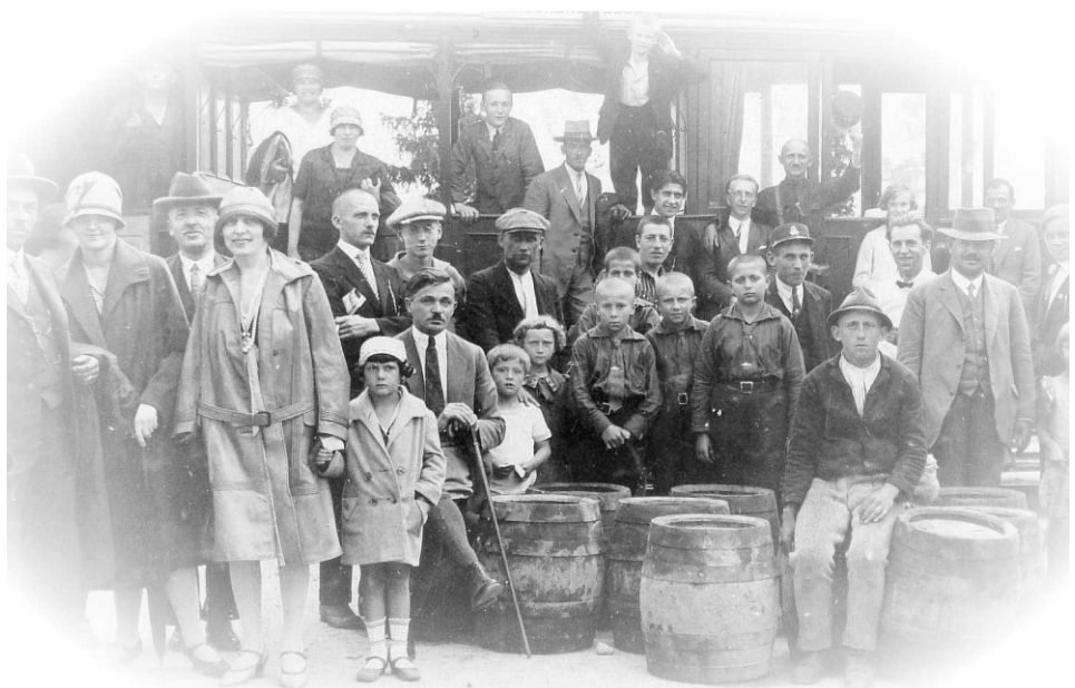
Fortepan / Orig: Fortepan / 1921