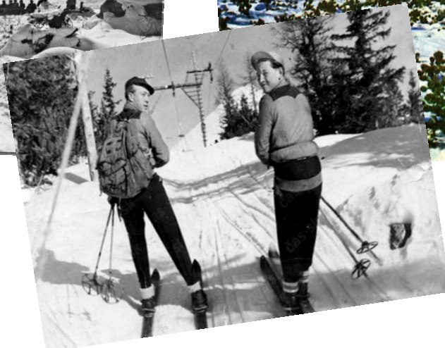
smeroval od jazera na Solisko