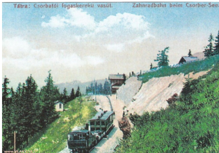
Csorbátói vasút, Mátyás király emlékére. Minden jog fenntartva. 1918