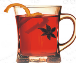
TATRATEA 52% Original v horúcom čaji