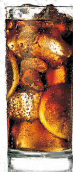
COLATEA 4cl TATRATEA 52% 20cl COLA, ľad, rez citrónu