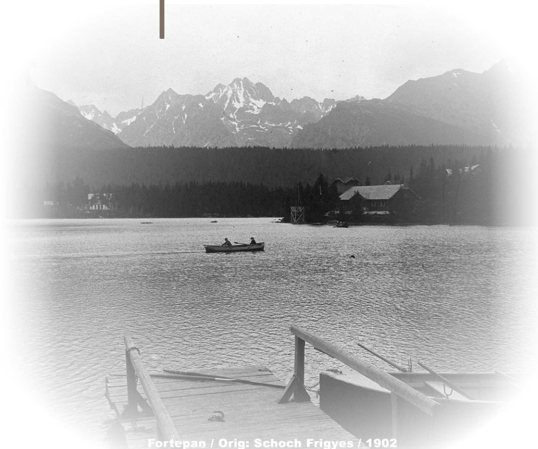
Fortepan / Orig: Schoch Frigyes / 1902